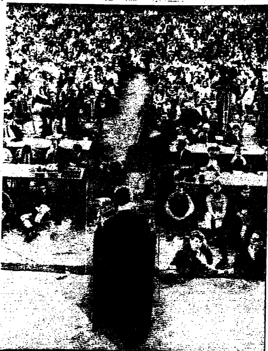
الاستاذ روبرت كيني يقف مسرخا وهو يخاطب جمهورا متحمسا مؤلفا من ١٠٠٠ طالب في جامعة ولاية كنساس في اول جولته للحصول على ترشيح الحزب الديمقراطي له في انتخابات الرئاسة خصوصا بذلك الرئيس ليندون جونسون

ولن ننزع اصحاب الملايين كراماتهم، حين نصل حدود «اسرائيل الكبرى» - لا تقدر الله - الى شواطي بربدي، والقراتين، وترتفع نجمة داود فوق القتل المشرفة على المدينة المحورة!